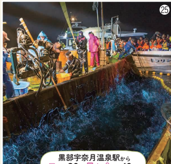
黒部宇奈月温泉駅から 車で約30分、 員+9 で約60分