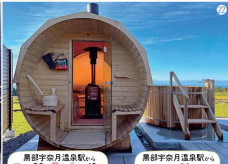
黒部宇奈月温泉駅から 車で約30分、 員+9 で約60分