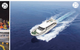
黒部宇奈月温泉駅から 車で約40分、 員+9 で約60分