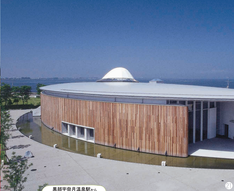
黒部宇奈月温泉駅から 車で約30分、 員+9 で約60分