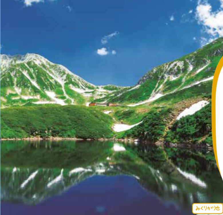
受入人数 制限なし