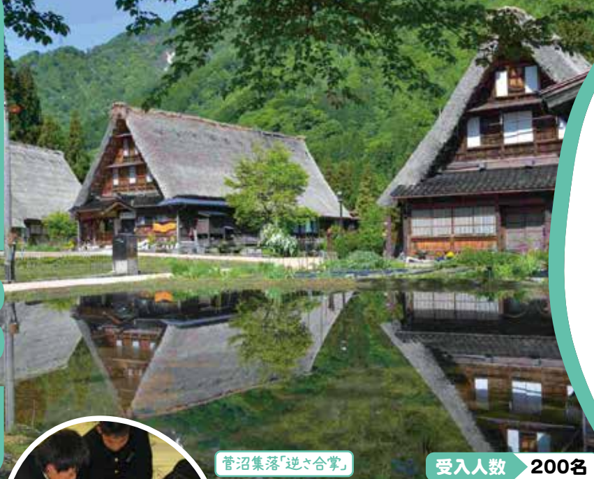
菅沼集落「逆さ合掌」

世界遺産 五箇山の合掌造り集落(菅沼集落)のすぐそばにある「合掌の里」は、合掌造りの保存を目的として村内から移築された家屋を、宿泊学習のために整備した施設です。実際の合掌造りでの宿泊や、五箇山ならではの体験は、きっと日々の暮らしを見つめ直すきっかけとなります。