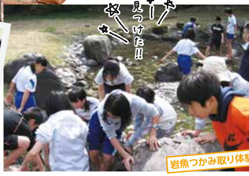
岩魚つかみ取り体験