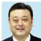
長井 健司 2013年 表彰