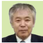
前 啓道 2014年 表彰