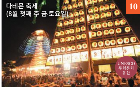
다테몬 축제 (8월 첫째 주 금·토요일) 10