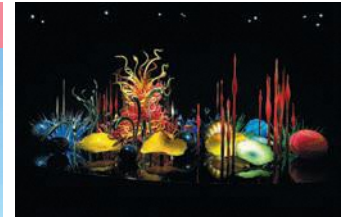
Dale Chihuly, Toyama Mille Fiori, 2015, H280xW940xD580cm, Toyama Glass Art Museum