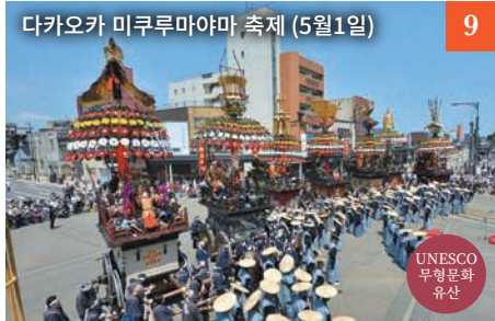
다카오카 미쿠루마야마 축제 (5월1일) 9