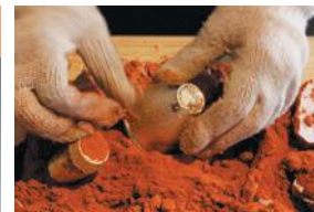
다카오카 청동 제품

다카오카 청동 제품을 만드는 법을 배워 찻잔이나 작은 접시 등의 주석 제품을 만드는 체험도 가능하다.