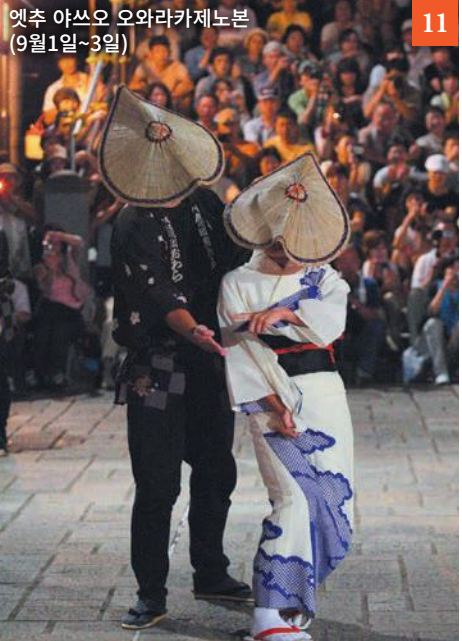
옛추 야쓰오 오와라카제노본 (9월1일~3일) 11