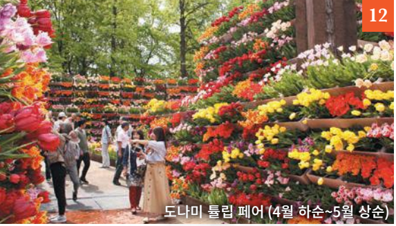
도나미 튜립 페어 (4월 하순~5월 상순) 12