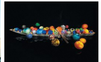
Dale Chihuly, Toyama Float Boat, 2015, H60xW917.5xD657.5cm, Toyama Glass Art Museum