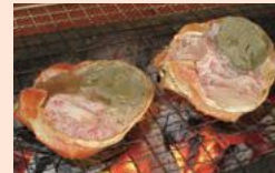
สถานีชายทะเล "ชินคิโระ" (เมืองชิมาเอะ E-1)

ที่นี่มีอาหารทะเลสดๆ ไปบริการและจำหน่าย รวมถึง ยังมีผลิตภัณฑ์ที่ส่งมอบไปยังร้านอาหารในหลายๆ ร้านค้า-ภัตตาคารและภัตตาคารอาหาร จะมีการทำพิธีพิธีอาหารทะเล