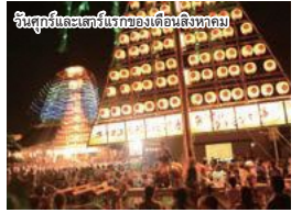
▲ เทศกาลทาเดมะง เมืองฮิโรชิมา E-2

เสลียง 6 เสลียงที่ตกแต่งอย่างสวยงามโดยช่างฝีมือพร้อมภาพสลักจะถูกแห่ไปรอบเมือง เพลงพื้นบ้านชื่อ โสริ-อุตะ จะถูกขับร้องผสมผสานไปกับดนตรีซอ ซามิเซ็น ที่อยู่ขบวนหน้าสุดของเสลียง