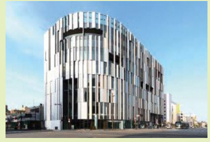
▲ พิพิธภัณฑสถานศิลปะประจักษ์แห่งโทยามะ เมืองโทยามะ D-2

ที่นี่เป็นพิพิธภัณฑสถานใหม่ที่ได้รับการออกแบบโดย เคเนโกะ คุมะ ซึ่งเป็นนักสถาปัตยกรรมที่มีชื่อเสียงระดับโลก ที่นี้จัดให้มีการแสดงงานศิลปะประจักษ์สมัยใหม่ รวมทั้งผลงานการคิดค้นของช่างแกะสลักแก้วชื่อดังอย่าง ดาเละ ชิฮุริ (Dale Chihuly)