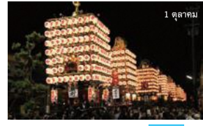
▲ เทศกาลชินมินาโตะ อิกิยามะ เมืองฮิโรชิมา C-1

เทศกาลนี้มีประวัติยาวนานถึงประมาณ 300 ปี เป็นเทศกาลที่มีการแสดงเต้นรำในยามค่ำคืน ในขณะที่ใช้ท่าทางที่เรียบง่ายแต่ไพเราะน่าใจ ซึ่งเล่นด้วย ซามิเซ็น และซอซังจิน เราจะได้รับชมความประทับใจจากนักเต้นที่สง่างามที่เต้นบนท้องถนนที่ประดับประดาด้วยโคมไฟกระดาษนับพัน