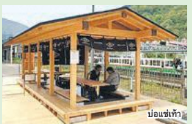
บ่อแช่เท้า