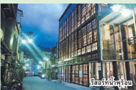
รีสอร์ทที่น้ำพุร้อน