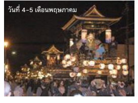
▲ เทศกาลโงยามะ อิดิยามา เมืองโงยามะ A-3

เสลียงจำนวน 7 เสลียงที่ตกแต่งประดับประดาด้วยเครื่องทองและน้ำมันสน และจัดขบวนแห่บนไปรอบเมือง โยโตชิของงานคือความประทับใจในความสวยงามเมื่อเสลียงทั้ง 7 มาอยู่ด้วยกัน