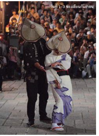
วันที่ 1-3 ของเดือนกันยายน

• 6 นาที จากสถานีโทนามิ ไซโตะ • 10 นาที จากสถานีโทนามิ ไซโตะ บนทางด่วนสายโทสุกุ • 1 ชั่วโมง 20 นาทีจากสถานีโทนามิ ไซโตะ จากสถานีโทยามะ-คางาชิมา-คางาชิมา