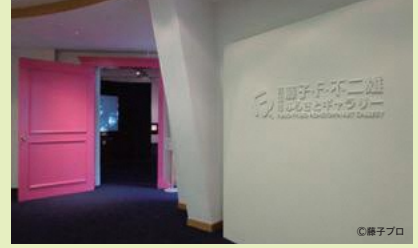
▲ ห้องจัดแสดงงานศิลปะบ้านเกิดของ ฟุจิโกะ เอฟ ฟุจิโอะ เมืองโทยามะ B-2

• 3 นาที จากสถานีโทยามะ-คางาชิมา-คางาชิมา