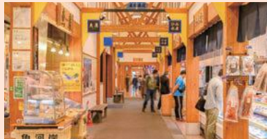
ถนนชิมิ บันยะ (เมืองชิมาเอะ E-1)

ที่นี่เป็นตลาดที่จัดจำหน่ายอาหารทะเลสดมากมายที่นำมาจากท่าเรือชินมินาโตะ อาทิ กุ้งแก้ว และปูหิมะแดง เป็นต้น