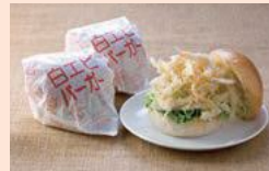
สถานีชินอนัน "คิมม่อนท์กินมินาโตะ" (เมืองชิมาเอะ E-2)

ที่นี่มีปูต่างๆ ของญี่ปุ่นและผลิตภัณฑ์ที่ขึ้นชื่อมีจำหน่ายและจัดจำหน่าย นอกจากนี้ ยังมีผลิตภัณฑ์ที่ส่งมอบไปยังร้านอาหารในหลายๆ ร้านค้า-ภัตตาคารและภัตตาคารอาหาร จะมีการทำพิธีพิธีอาหารทะเล