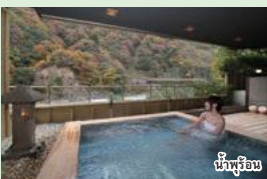
น้ำพุร้อน