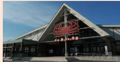
ตลาดชินมินาโตะ คิตะโตะคิตะ (เมืองชิมาเอะ E-1)