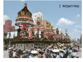
▲ เทศกาลทาคาโอกะมิคุรุยะยามะ เมืองทาคาโอกะ B-2

เทศกาลญี่ปุ่นทั้ง 33 เทศกาล ที่เป็นการแห่ขบวนเสลียงไปรอบๆ เมือง ได้รับการบันทึกไว้เป็นมรดกทางวัฒนธรรมที่จับต้องไม่ได้โดยยูเนสโก ซึ่งในจำนวนนี้มี 3 เทศกาลที่เป็นของไทยมาะ