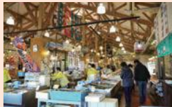
สถานีปลา "อิคุจิ" (เมืองชิมาเอะ E-1)

ที่นี่มีอาหารทะเลสดๆ ไปบริการและจำหน่าย รวมถึง ยังมีผลิตภัณฑ์ที่ส่งมอบไปยังร้านอาหารในหลายๆ ร้านค้า-ภัตตาคารและภัตตาคารอาหาร จะมีการทำพิธีพิธีอาหารทะเล