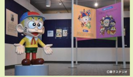
▲ ห้องจัดแสดงซึโอคาเซะแห่งเมืองฮิมาชิ เมืองฮิมาชิ B-1

• 2 นาที จากสถานีโทนามิ ไซโตะ จากสถานีโทนามิ ไซโตะ • 20 นาที จากสถานีโทนามิ ไซโตะ บนทางด่วนสายโทสุกุ